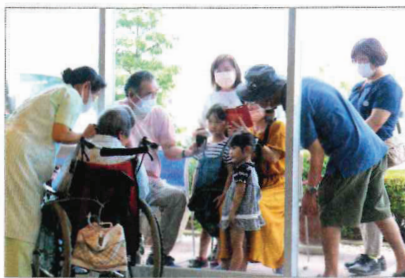
西山病院グループでは、患者と家族とのガラス越しの面会を導入。当初の予想より来院する家族が多く好評だ